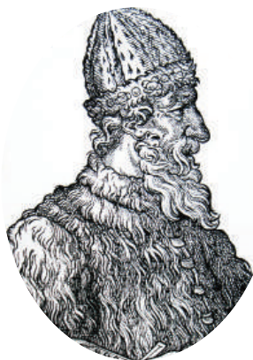
Великий князь Иван III

До XVIII века чиновники на Руси жили благодаря так называемым «кормлениям», то есть, при отсутствии оклада за исправление должности, разрешению на подношения от заинтересованных в их деятельности лиц. Одаривали их не только деньгами, но и «натурой» — мясом, рыбой, пирогами и пр., что было делом обыкновенным.